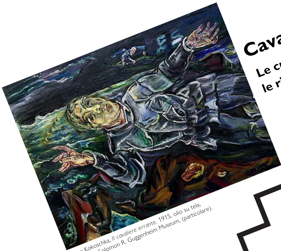
Oskar Kokoschka, Il cavaliere errante , 1915, olio su tela, New York, Solomon R. Guggenheim Museum, (particolare).

Incontro Presentazione Conferenza Premiazione Spettacolo Concerto Mostra Giornata cantonale