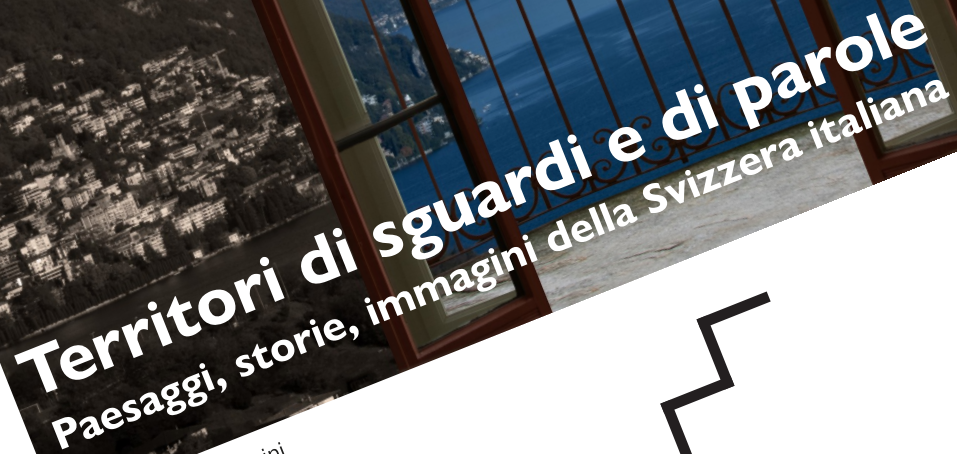
Immagine: Micol Ferrini

Conferenza Concerto Caffè narrativo Presentazione Spettacolo Esposizione Letture Premiazione Incontro