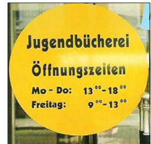
[ 1 ]