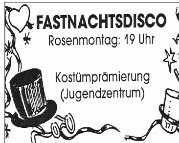
[ X ]