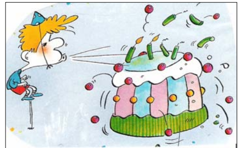
[ 3 ]