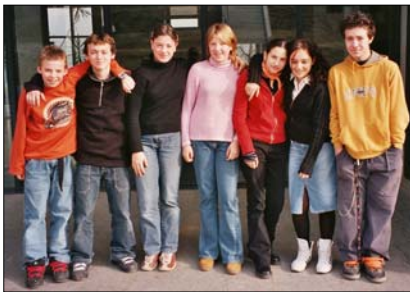
[ 5 ]

Ascolterai 5 testi riguardanti 5 situazioni. Ad ogni situazione corrisponde un'immagine. Abbina ad ogni situazione l'immagine adeguata. Scrivi il numero della situazione nel riquadro sotto l'immagine. Sentirai ogni situazione una sola volta. Un'immagine è di troppo, metti una crocetta nel riquadro.