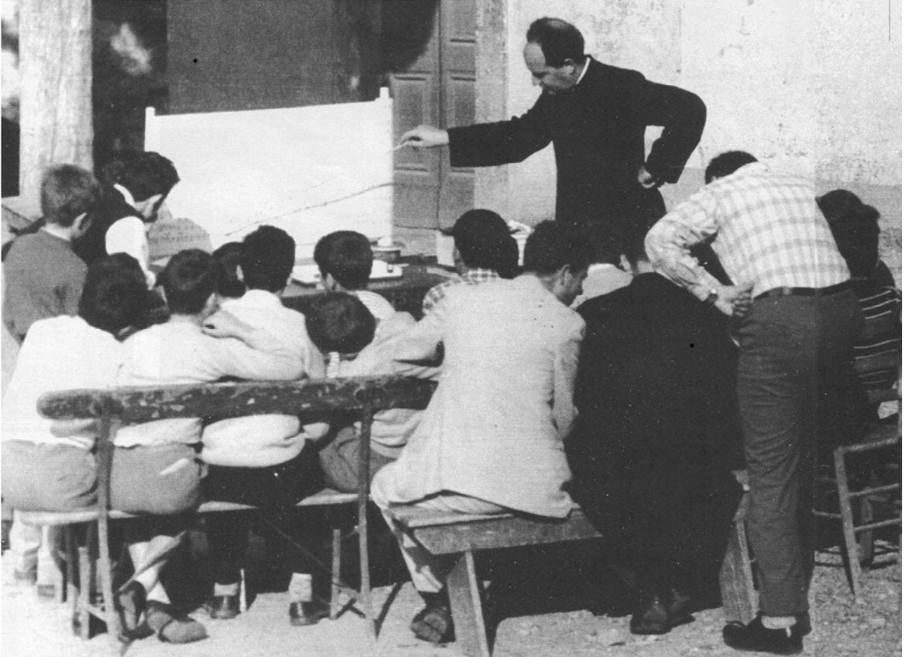
Imm. 3: Don Milani insegna ai suoi ragazzi di Barbiana

esse rappresenterebbero la negazione del sapere stesso. Second Hirtt (2009), "l'approccio per competenze costituisce semplicemente, a prescindere da quanto ne dicano i suoi difensori, un abbandono dei saperi" (p. 5).