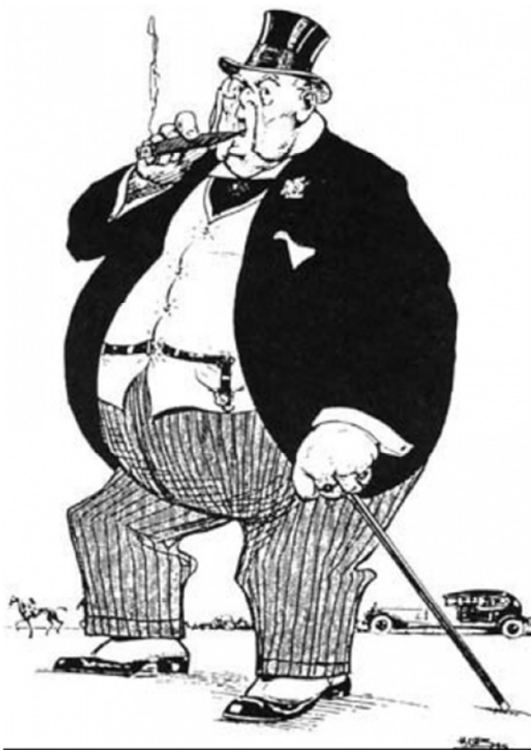
Imm. I: Una scuola al servizio dell'economia?

Per chi proviene dalle scienze dell'educazione e ha lavorato a lungo sull'azione educativa, non è sempre immediato comprendere la natura delle critiche al concetto di competenze. Lo strumento di analisi proposto è quello di determinare la solidità del piano concettuale che è all'origine di queste resistenze e di identificare in seguito il significato che le competenze possono assumere per la nostra scuola.