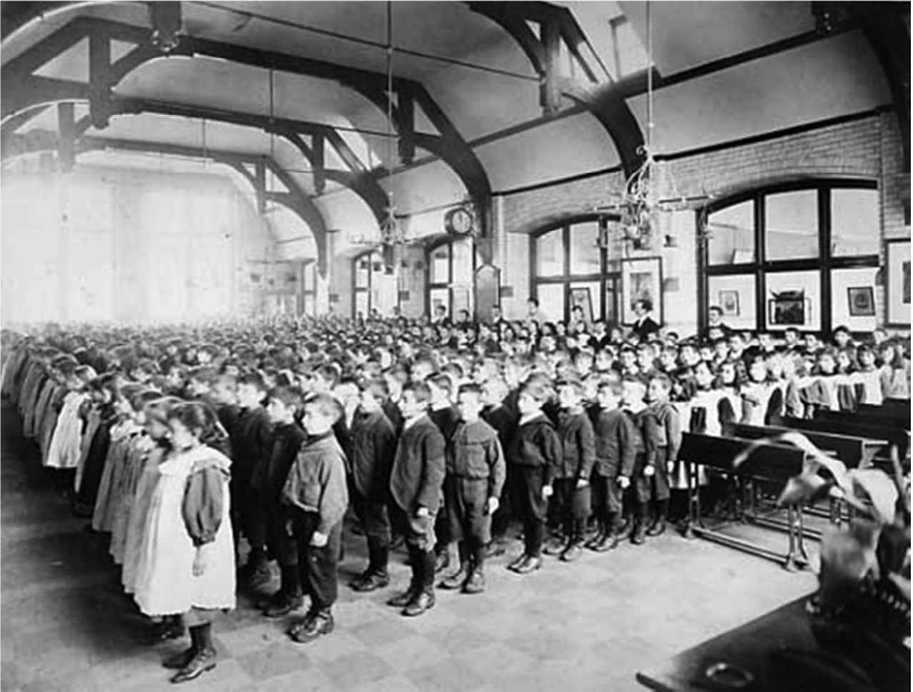
Imm. 2: La scuola dell'era industriale

Con l'avvento della società post-industriale, a partire dagli anni '80, il mondo del lavoro è profondamente mutato, passando da un tipo di produzione e organizzazione taylorista, per il quale servivano braccia con il meno cervello possibile, ad una produzione diversa, con la necessità di un alto tasso cognitivo. Lo stesso mondo economico ha quindi preso consapevolezza della necessità di poter disporre di persone pensanti, di persone ... competenti. Si è di conseguenza accorto che una scuola convenzionale, di pura trasmissione, quella nata appunto durante l'era industriale, non era più adatta ai propri modi produttivi. L'economia ha pure avvertito l'esistenza di altri modi di fare scuola. Modi che in realtà erano nati prima dell'era post-industriale ma che – come già accennato – sono rimasti per molto tempo inascoltati e ignorati dalle istitu-