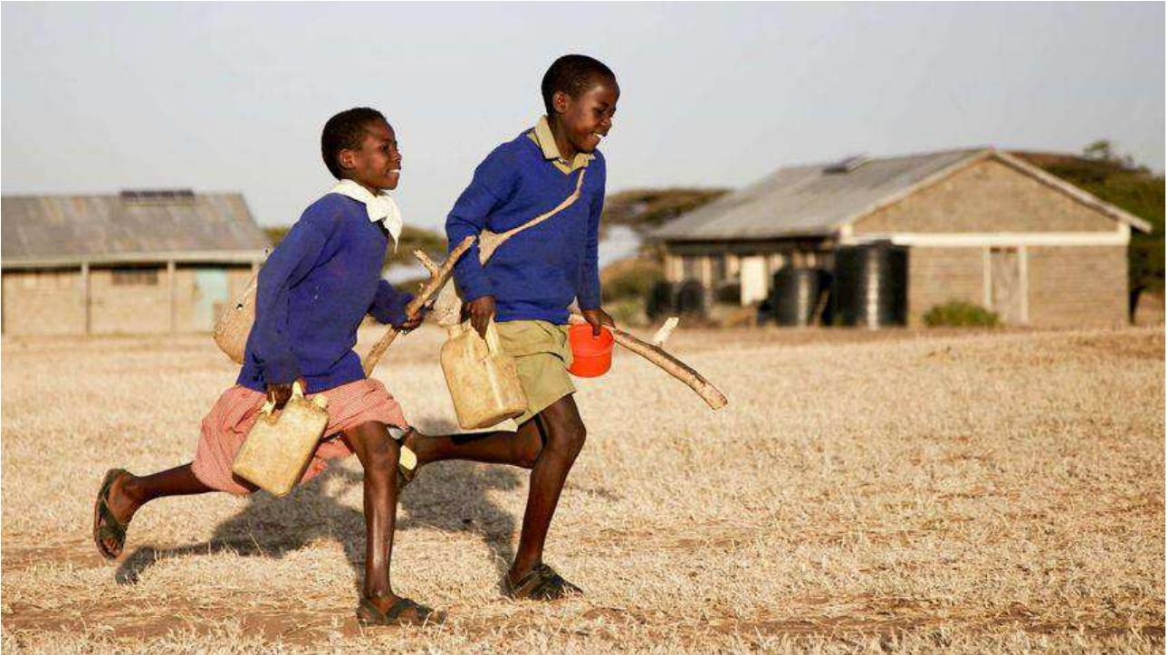
Imm. 5: Fotogramma tratto dal film "Vado a scuola" di Pascal Plisson (2013)