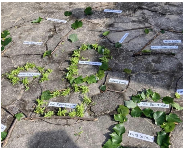
Fase di realizzazione con elementi naturali del quartiere da parte degli allievi.jpg