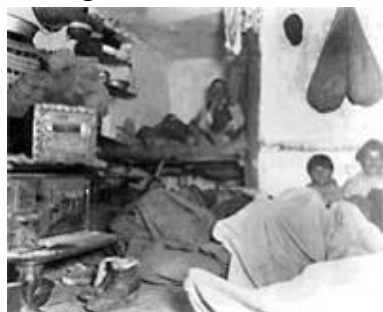
Cabina di una nave d'emigrazione